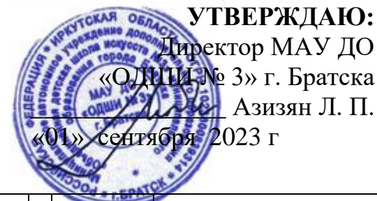
График образовательного процесса по дополнительной предпрофессиональной программе в области музыкального искусства «Народные инструменты» (срок обучения 8 лет)