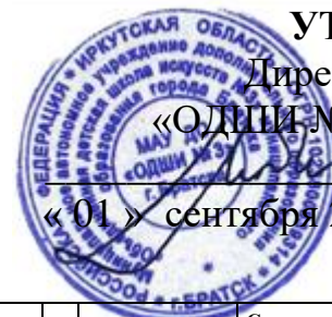
График образовательного процесса по дополнительной предпрофессиональной программе в области музыкального искусства «Духовые и ударные инструменты» (срок обучения 8 лет)