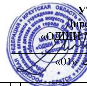
График образовательного процесса по дополнительной предпрофессиональной программе в области музыкального искусства «Духовые и ударные инструменты» (срок обучения 5 лет)